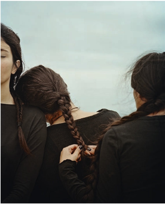
Hoda Afshar, Untitled #4 (aus der Serie In Turn ), 2022 © Hoda Afshar/Milani Gallery, Meeanjin/Brisbane