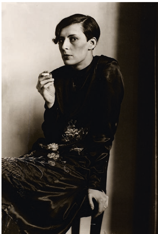
August Sander, Sekretärin beim Westdeutschen Rundfunk in Köln , 1931

Begleitet wird die Ausstellung von vielfältigen Veranstaltungs- und Vermittlungsangeboten, darunter ein digitales Symposium, Künstler:innengespräche, Performances, Workshops, Filmscreenings und Aktionen rund ums Haar.