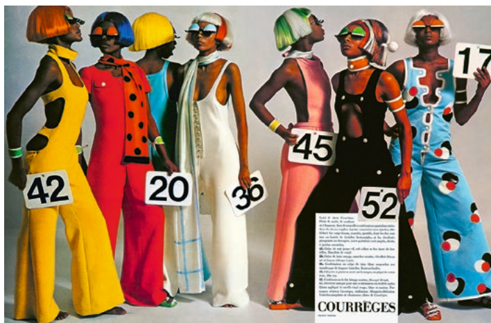
Helmut Newton, Courrèges , French Vogue 1970 © Helmut Newton Foundation, Berlin

Die Ausstellung Grow It, Show It! nähert sich über eine große Bandbreite von historischen bis aktuellen Fotografien, Videos und Filmclips aus Kunst, Mode und Social Media der geschichtlichen, politischen wie alltagskulturellen Bedeutung von Haaren. Haare – das zeigt die Überblicksschau – sind Informationsträger. Die Art und Weise, wie wir Haare tragen, ist nicht nur bedingt vom Streben nach Schönheitsidealen, sondern als identitätsstiftendes Merkmal, rituelles Machtsymbol, spirituelles Material und sozialer Status seit jeher politisch und gesellschaftlich aufgeladen.